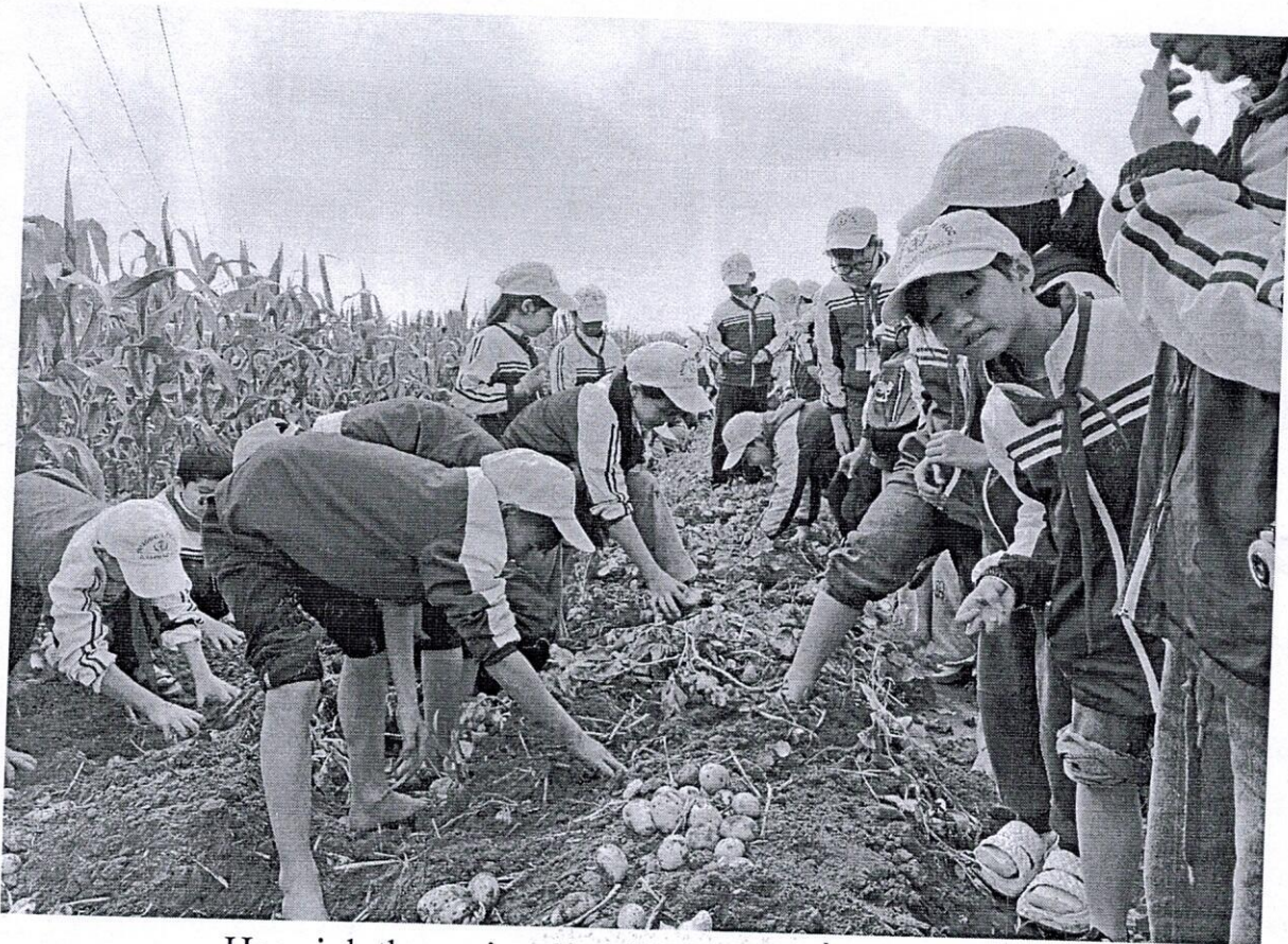
Học sinh tham gia trải nghiệm cánh đồng khoai tây