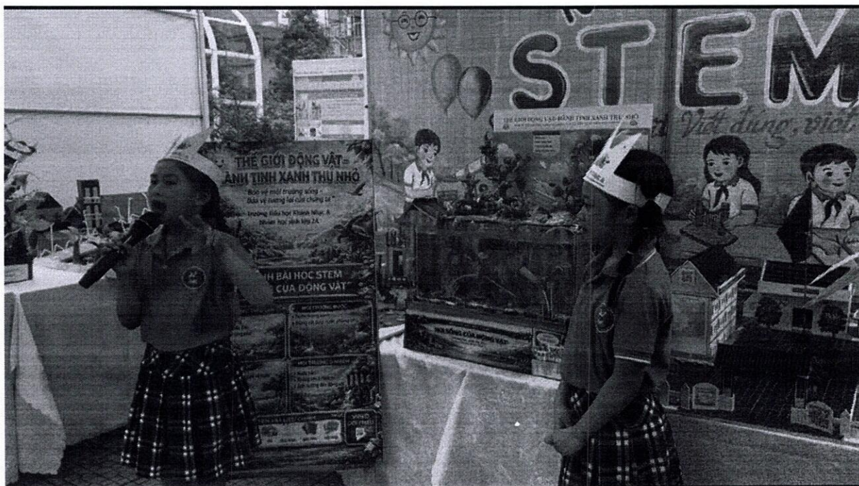
Kết quả khảo sát trước và sau khi thực hiện

học sinh Tiểu học tỉnh Ninh Bình năm học 2025 – 2026, Giới thiệu sách và video dự thi Đại sứ văn hóa đọc