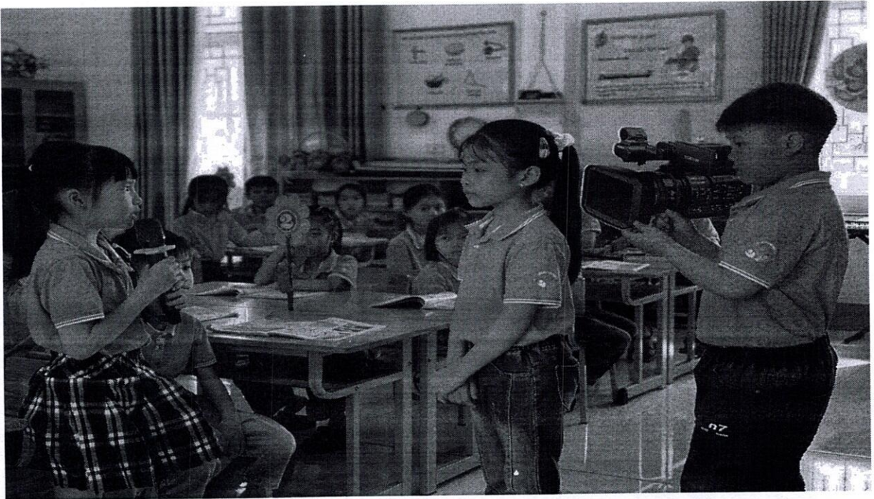
HỌC SINH CHƠI TRÒ CHƠI “PHÓNG VIÊN NHÍ”

Nhiều em trước đây ngại nói đã bắt đầu giơ tay phát biểu, dám trình bày trước lớp, biết nêu quan điểm cá nhân rõ ràng hơn; mạnh dạn, tự tin tham gia các trò chơi để giải quyết nhiệm vụ học tập.