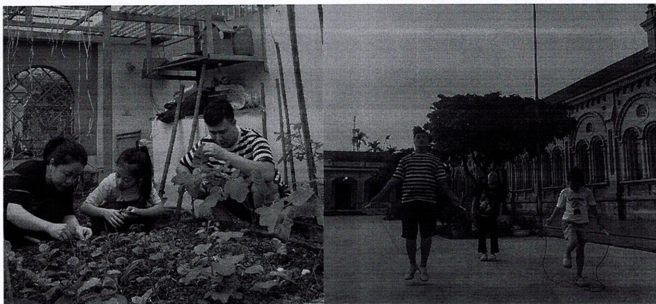
HỌC SINH THAM GIA VIỆC NHÀ

Hiệu quả: Nhiều em tiến bộ nhanh hơn khi được rèn luyện đồng bộ ở trường và ở nhà.