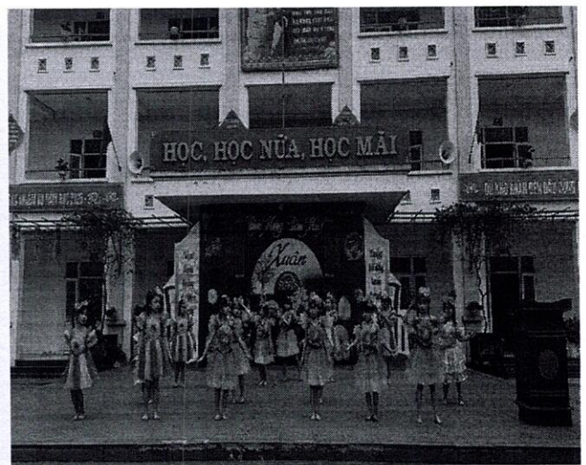
HỌC SINH TRẢI NGHIỆM GÓI BÁNH CHƯNG – BIỂU DIỄN VĂN NGHỆ